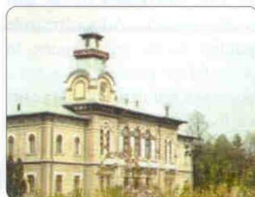
Primăria Tg. Jiu